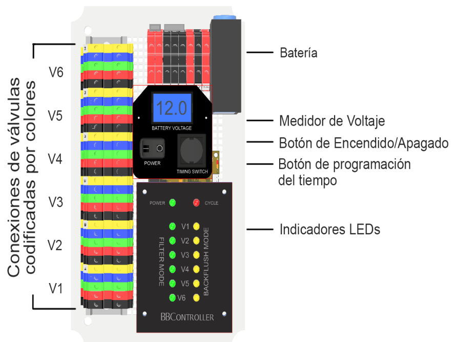
* Figure 1 – BBController

Después de 2.5 minutos, las válvulas 4 y 6 regresan al modo filtro, seguido por las válvulas 1 y 2, regresa el indicador a color verde.